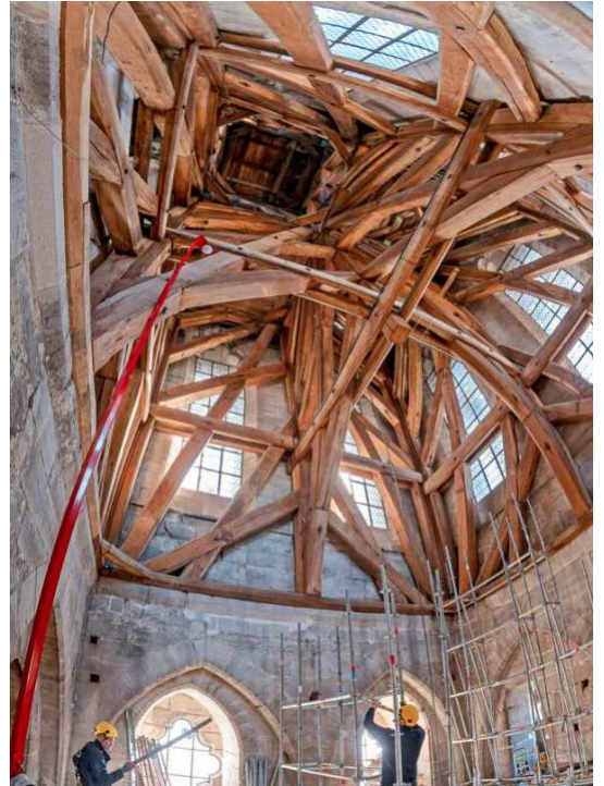
Signalé par Jean-Louis Thomasset