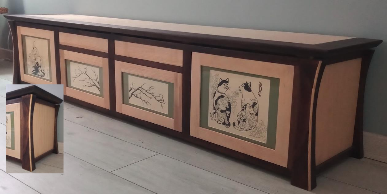
Partie basse d'un meuble Yin-Yang.